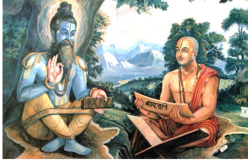
Рис. 5. Брахмани – члени вищого сослов'я індістського суспільства

важливих державних посад. В даний час брахмани існують у всіх штатах Індії і служать духовними наставниками в сім'ях більшості каст вищого або середнього статусу.