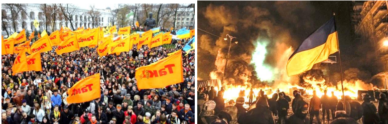
Рис. 10. Помаранчева революція та революція гідності в Україні

З моменту здобуття Україною незалежності, країна пережила дві революції (2004 і 2014 рр.). На жаль, ці революції не дали того, що від них очікували. Позитивні придбання народного руху, без сумніву, мали місце. Але, це не те, на що очікували люди у підсумку. В результаті українська державність не може виявити ознак відновлення і зміцнення, які їй необхідні, а українське суспільство, виснажене напругою і невдачами, перебуває в апатії, духовному розброді та зневірі. Преса і література залиті демагогією, брудними викриттями, творами з результатами псевдоінтелектуальних досліджень у науковій та культурній сферах. Абсурдність у внутрішньодержавній політиці породжує руйнівні тенденції на всіх рівнях державної влади, даючи дорогу для циніків і авантюристів, які знищують залишки принципівості і моральності у чиновництві, сприяють розвалу державного устрою. Зарубіжні партнери все частіше роблять неприємні, принизливі висловлювання з приводу подій, що відбуваються у країні та за результатами її зовнішньої політики [18].