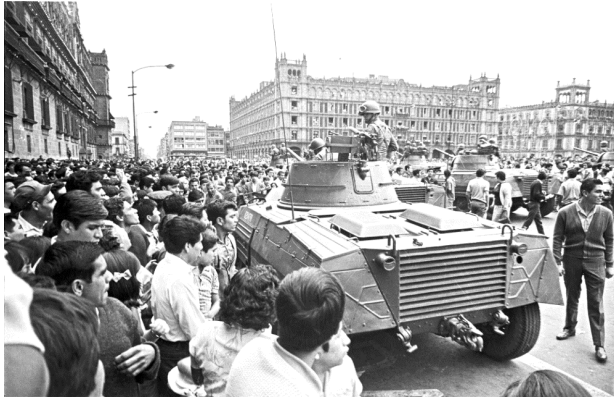
Рис. 9. Студентські протести в Мехіко, 1968 р.

Демократична більшість інтелектуальної спільноти, виходячи зі своїх економічних інтересів, вступає в конфлікт з капіталом, його антигуманними цілями і політикою. Вершиною цього протистояння стала так звана студентська революція кінця 1960-х рр. Ця революція включала в себе різні протестні виступи молоді у багатьох країнах світу. В першу чергу вони були спрямовані проти участі США у війні в В'єтнамі, але також протестуючі боролися за права людини, проти расизму, виступали на підтримку фемінізму і захист навколишнього середовища. Цікаво відзначити, що ці протести в США і країнах Західної Європи відбувалися на тлі стабільного економічного зростання. Так, в США в 1961–1966 роках валовий національний продукт зростав приблизно на 4–6% на рік, тобто у два рази швидше темпів п'яти попередніх років, безробіття скоротилося до рекордно низького рівня. З цього випливає, що причини протестів були не економічними, а світоглядними.