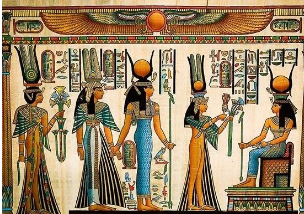
Рис. 3. Єгипетські жреці

Існують різні думки з приводу ролі жреців в житті Стародавнього Єгипту. Так, одні вважають, що контроль жреців негативно відбивався на життя єгиптян і на розвитку держави. За версією інших – жреці – хранителі священних традицій – зіграли позитивну роль в історії і культурі Стародавнього Єгипту.