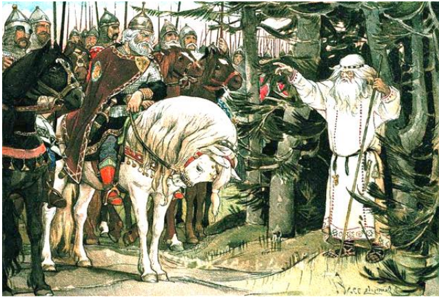
Рис. 4. Волхви в Стародавній Русі – радники князів

Волхви, також як і жреці стародавнього Єгипту, користувалися великим впливом, були радниками руських князів. Згідно «Повісті временних літ» (початок XII століття), князь Олег до походу на греків запитав «волхвів і віщунів», від чого він помре, і один з них відповів: від улюбленого коня. Олег зарікся сідати на коня і лише на п'ятий рік після походу згадав про нього. Тоді князь довідався, що кінь помер, і сказав: «То ти неправо глаголють волсьви... конь умерлъ есть, а я живъ». Він знайшов череп коня і потоптав його ногою. З черепа вийшла змія, вжалила князя в ногу, і той помер.