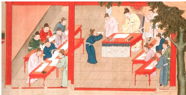
Рис. 6. Освічені чиновники шеньши в імператорському Китаї

В імператорському Китаї в управлінні державою активну участь брала каста освічених чиновників (шеньши). Шеньши в перекладі з китайської буквально означає – «вчені мужі, що носять широкий пояс» (символ влади в давнину) – один з чотирьох офіційних станів. Для отримання державної посади необхідно було скласти спеціальні державні іспити. Шеньши належали до освіченої частини панівного класу [14]: вони виступали хранителями конфуціанської ідеології і традицій, які диктували прихильність ідеям державності. Прихильність ритуалу у шеньши виявлялася вельми широко: від приховування недоліків, що мотивується «небажанням турбувати» начальство, до жертвовного викриття пороків аж до імператора.