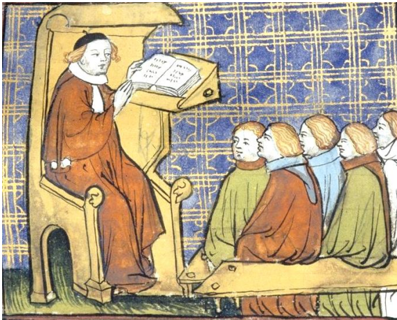
Рис. 7. Середньовічна європейська християнська школа

З розвитком капіталізму інтелектуали поступово перетворюються в постійно зростаючий прошарок людей розумової праці, які живуть за рахунок продажу її продуктів або своєї робочої сили. Спочатку в цей шар входили лише юристи, вчителі і лікарі. Однак в ході індустріалізації різних галузей людської діяльності з'являються інженерно-технічні та науково-технічні інтелектуали. На перших стадіях розвитку капіталізму більшість інтелектуалів є економічно незалежними фахівцями, так званими особами «вільних професій». Соціальне становище інтелектуалів носить проміжний, міжкласовий характер, через що вони визначаються марксистами як «прошарок» між класом експлуаторів і класом експлуатованих.