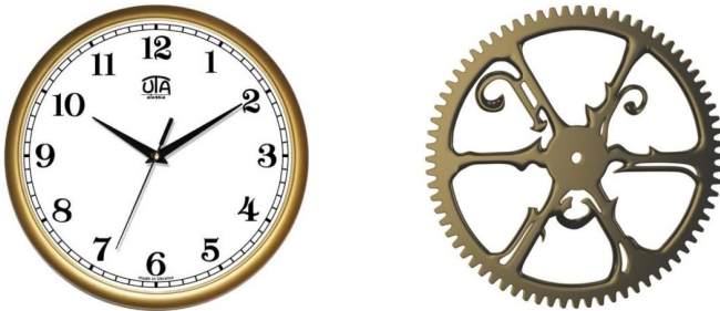
Рис. 2. Годинник та колесо – обидва вироби з металу і обидва мають круглу форму

Але чи можна спираючись лише на одну ознаку, робити висновки про неспроможність ознак інтелігента за Тепікінім? Дамо пояснення на прикладі порівняння годинника з колесом (див. рис. 2). І той, і інший вироби виготовлені з металу і мають круглу форму (тобто маємо збіг за двома ознаками), але це зовсім не означає, що за допомогою колеса можна визначати поточний час!