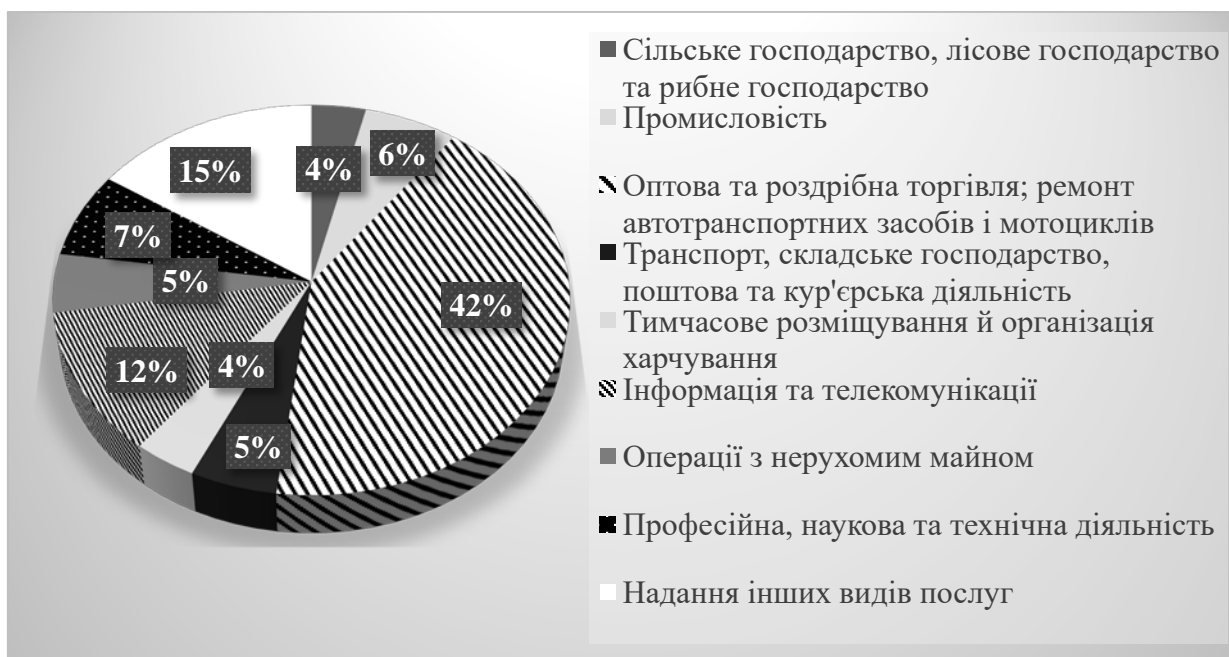
Рис. 1.1. Структура суб'єктів господарювання в Україні за 2020 рік за видами економічної діяльності