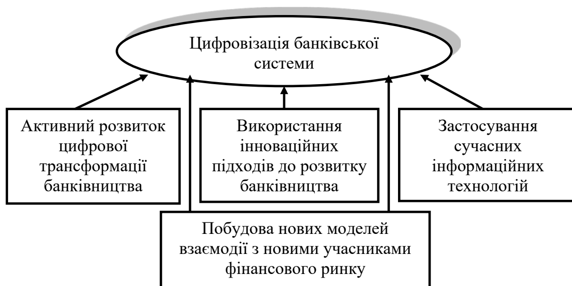
Рис. 1. Ключові складові цифрової трансформації сучасного банківського сектора

Варто зазначити, що зазначені зміни, насамперед, обумовлені цифровою трансформацією сучасного банківського сектора (рис. 1).