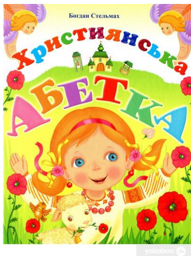
Лл. 2. Богдан Стельмах «Християнська абетка» 2