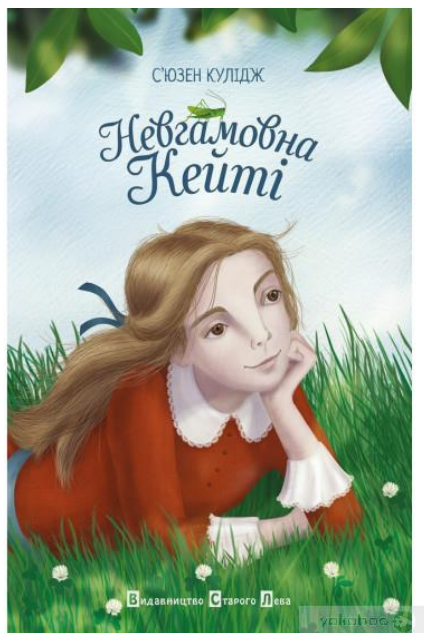
Іл. 4. С'юзен Кулідж «Невгамовна Кейті» 4