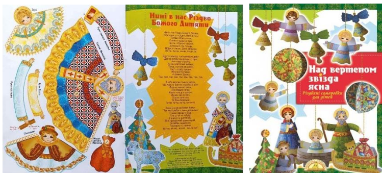
Іл. 3. Над вертепом звізда ясна. Різдвяні саморобки 3