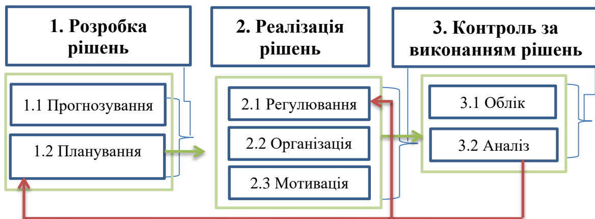
Рис. 2. Загальна система управління витратами

Очевидно, що управління витратами передбачає виконання багатьох дій, які реалізуються під час фінансового управління підприємством будь-яким об'єктом, а саме: розроблення і реалізацію рішень, а також контроль за їх виконанням. Такі дії реалізуються через елементи управлінського циклу, такі як: прогнозування, планування, організацію, мотивацію, облік та аналіз. Функцію оберненого зв'язку загальної системи управління витратами підприємства виконує контроль (рис. 2).