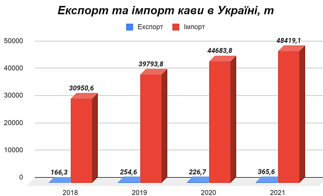
Рис. 2. Динаміка виробництва кави в Україні за 2018–2021 роки

Просування продукції та інші PR-заходи також сприяли збільшенню попиту на каву. Зокрема, у Львові та Києві були організовані кавові фестивалі, які просували українську якісну каву, можливості подальшого розвитку кавової індустрії та обмін досвідом у виробництві та маркетингу кави.