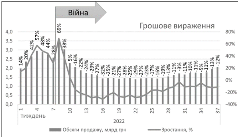
Рис. 1. Динаміка роздрібних продаж, 2022 рік потижнево

Був «класичний» для зимнього сезону гострих респіраторних захворювань розвиток подій (рис. 1) [3].