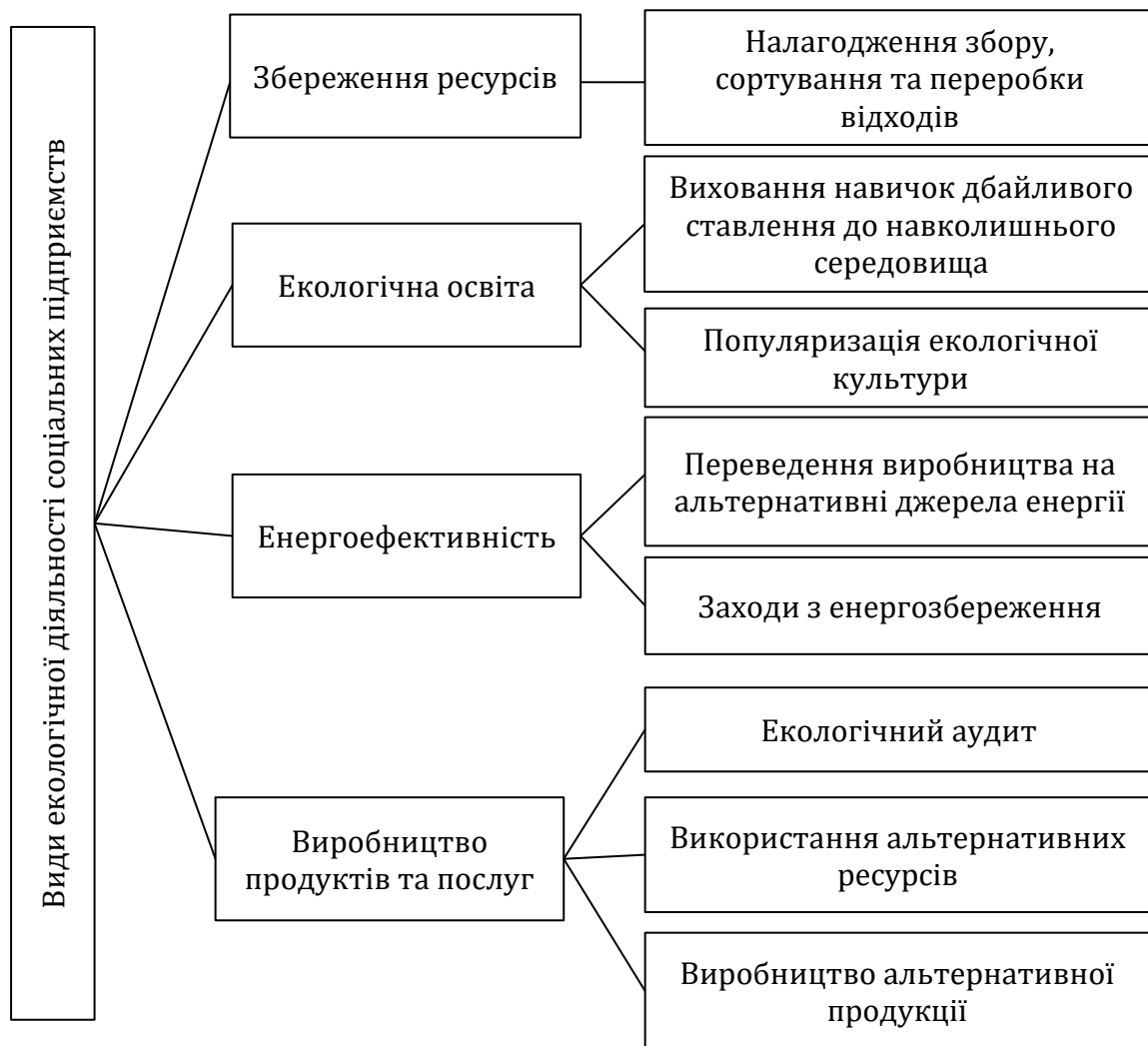
Рис. 2. Види еколого-орієнтованих соціальних підприємств

Разом з тим, варто розуміти різницю між підприємствами, які функціонують в сфері екології та еколого-орієнтованими соціальними підприємствами. Останні, крім того, як чинити позитивний вплив на навколишнє середовище, обов'язково ставлять перед собою ще й соціальну мету, на досягнення якої направляють частину свого прибутку та зусиль.