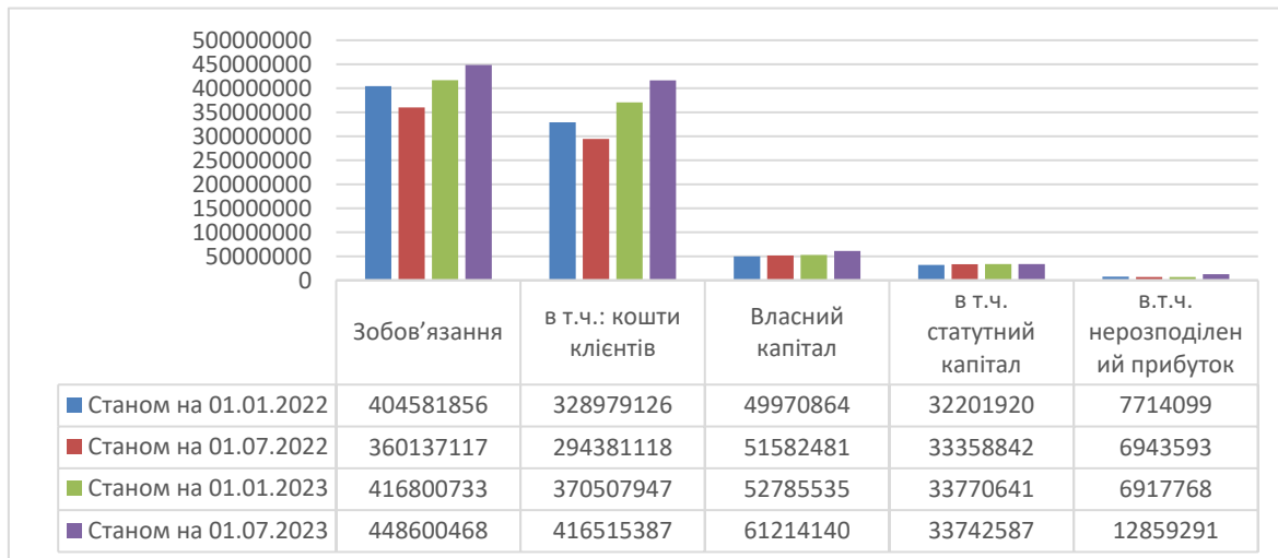
Рис. 3. Динаміка ресурсної бази банків з приватним капіталом, тис. грн

зобов'язань пов'язане зі зростанням коштів клієнтів на 26,6%, причому збільшилися як кошти суб'єктів господарювання, так і кошти фізичних осіб. Кошти залучені від суб'єктів господарювання зросли на 5,61%, в тому числі кошти на вимогу скоротились на 5,07%. Кошти залучені від фізичних осіб зросли на 3,69%, в тому числі на вимогу на 3,05% (рис. 3).