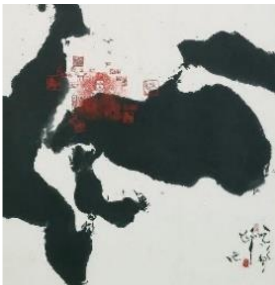
Рис. 1. Гу Ганг, Серце Китаю, 1988, чорнило на папері, 103x102 см [4]

В його роботі «Серце Китаю» виділяється роль крапки. Надихнувшись ієрогліфом «серце» (心 xīn), в якому крапки відіграють головну роль, майстер створює композицію плямами, в якій про каліграфію нагадує баланс чорного та білого, а також заповненість та пустота.