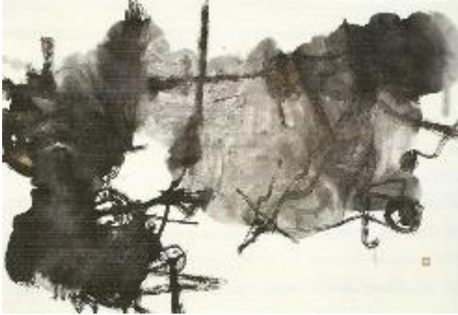
Рис. 3. Пу Лі Пінг. Музична серія 1. 2007. Чорнило на папері [8]

Сучасні китайські митці розглядають точку і лінію не просто як технічні прийоми, а як самоцінні об'єкти, здатні нести певний концептуальний зміст. Крапка у їхніх роботах може символізувати Всесвіт, людське життя, енергію ці тощо, а лінія перетворюється на втілення руху, часу та емоційного стану. Важливою сучасною тенденцією є використання крапки та лінії для створення мінімалістичних абстрактних композицій, що відображають певні філософські ідеї та стани, а також набування геометричними елементами складних конотативних значень.