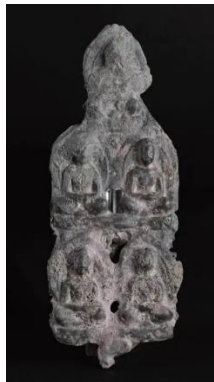
Рис. 2. М3015:9 Скульптурна група з 5 Татхагатк. Приблизно династія Хань. Провінція Шеньсі. Бронза, позолота. 15,6 x 6,4 см