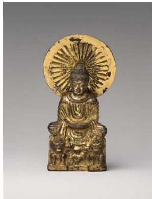
Рис. 4. Сидячий Будда. Приблизно 304–409 рр. н. е. Китай. Позолочена бронза. 16,5 x 7 x 3,5 см (Seated Buddha, probably Shakyamuni (Shijiamouni). The Metropolitan Museum of Art)