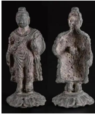
Рис. 1. М3015:10 Стояча статуя Будди. Приблизно династія Хань. Провінція Шеньсі. Бронза, позолота. 10,5 x 4,7 см

Отже, можна зробити висновок, що знахідки такого історичного масштабу в провінції Шеньсі підкреслюють актуальність теми впливу мистецтва Гандхари та буддистської сакральної пластики Китаю. Глибокі зв'язки, що пов'язують ці два регіони, знаходять усе більше підтверджень і свідчень свого існування та розвитку, а також дають змогу в подальшому вирішити питання «відсутності будд» у басейні річки Хуанхе.