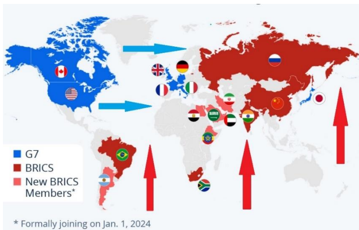
Рис. 1. «Вертикальне» об'єднання BRICS+ і «горизонтальне» G7