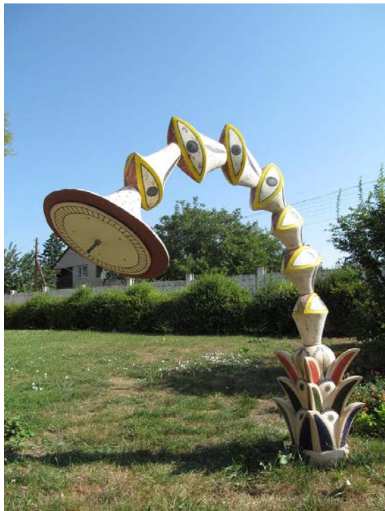
Рис. 5. Астрономічний гномон-календар української етноекології

форму, по центру та краях якого розміщені інсталяції із іконікою української екоетнологічної міфології, інстальовані сонячні гномони різних форм та конструкцій (рис. 5).