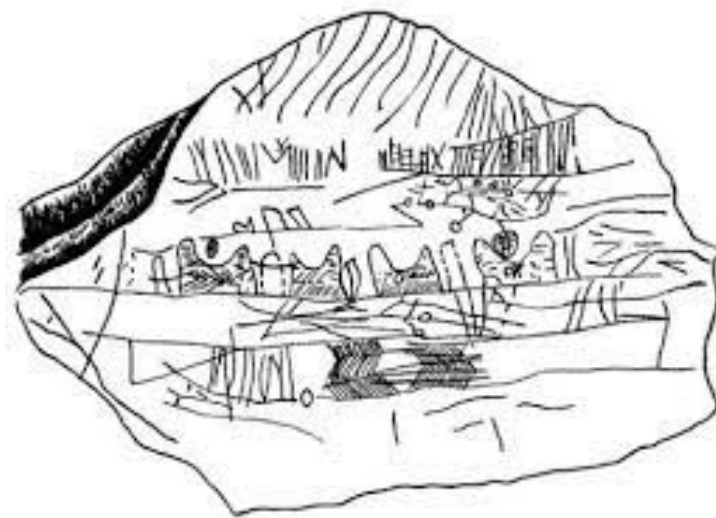
Рис. 4. Межирич-мапа праукраїнського зеленого хутора

Проект конкурентоздатної екологічної зеленої садиби реалізовано у с. Опішня Полтавської області. Інсталювані всі основні еколого-космогонічні уявлення українців та побудована на екологічних засадах гармонійного природокористування зелена садиба, застосовуючи технології захисту довкілля.