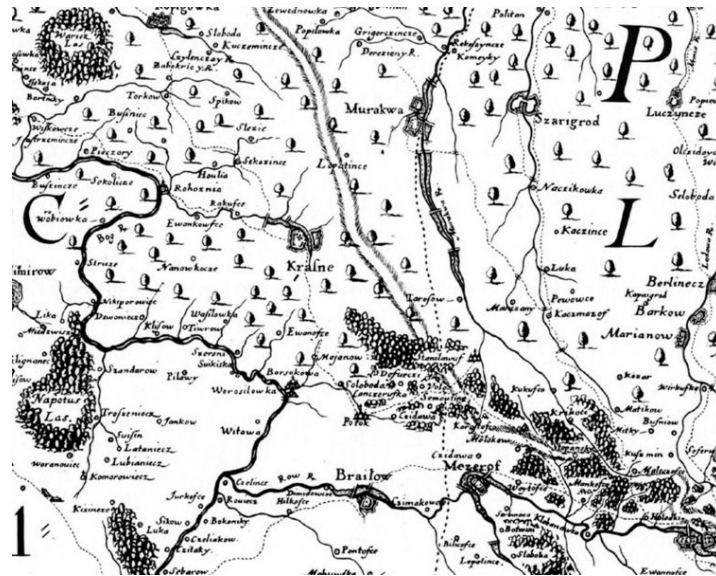
Рис. 3. Фрагмент мапи поселень території України

Межеріч-мапа показує соціально-економічні особливості розташування проукраїнського поселення із урахуванням всіх складових гармонійного та раціонального природокористування. Показані населенні місця, локації рілля, полювання, рибальства та перші зелені рекреаційні системи (рис. 4).