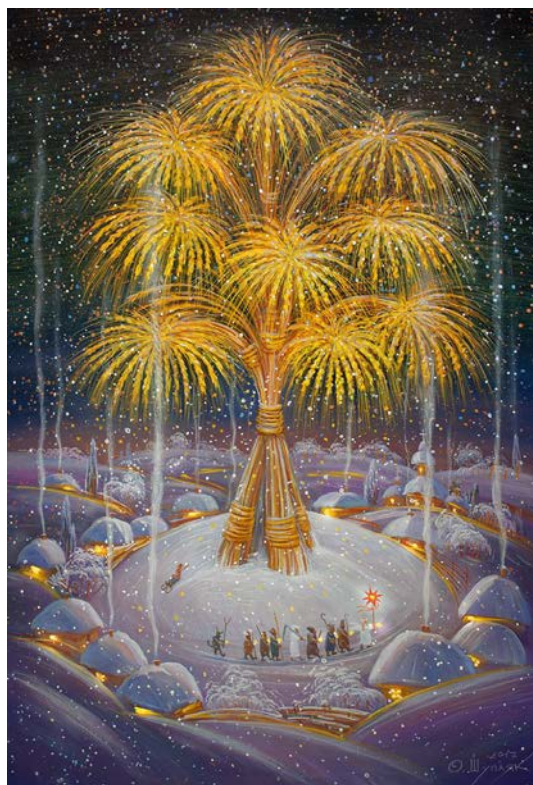
Рис. 2. Екокосмогонічний символ на картині Олега Шупляка

Центральним елементом у проекті зеленого хутора повинен стати величезний Дідух, як космогонічний обріг та астрономічний годинник життєвого циклу місцевої громади (в нашому випадку – екотуристів та рекреантів) (рис. 2). Це та особливість національно-етнічної особливості в соціально-економічній системі України, що була навмисно забута та знищена окупаційною російською радянською системою.