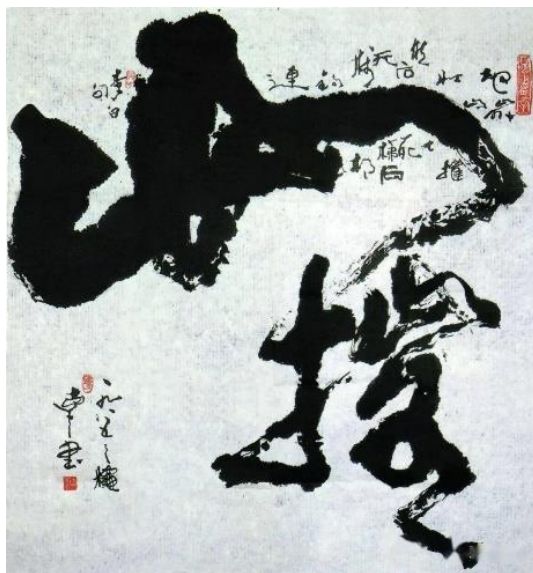
Гу Ган. Гори розбиваються (Shan cui 山推) (1985), чорнило на папері, 93,5 см x 87,5 см (the British Museum) [7]

Починаючи з кінця 19 століття, вплив західної культури та мистецтва в Китаї сприяв модернізації традиційних китайських мистецтв, включно з каліграфією. Художники почали використовувати нові матеріали та інструменти, такі як олійні фарби, полотно та пензель, а традиційні чорнило та папір використовувалися по-новому [4].