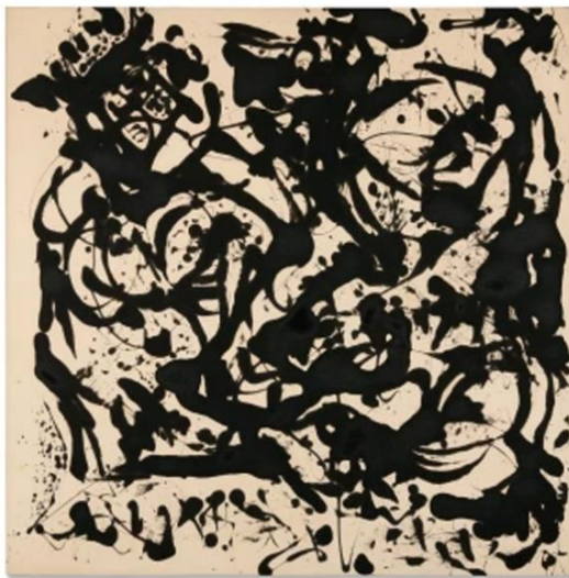
Джексон Поллок. Номер 17, 1951, емаль на полотні 148,6 x 148,6 см. [3]

Ці підходи мали спільне коріння в русі тіла і відображали глибокий вплив каліграфічного духу на західне абстрактне мистецтво. Франц Клайн, зокрема, відомий своїми монументальними чорно-білими полотнами, де використовує виразні каліграфічні мазки для передачі емоцій та жестів. Його творчість характеризується використанням швидких, але водночас ретельно обміркованих мазків, що створюють енергетичні та виразні композиції.