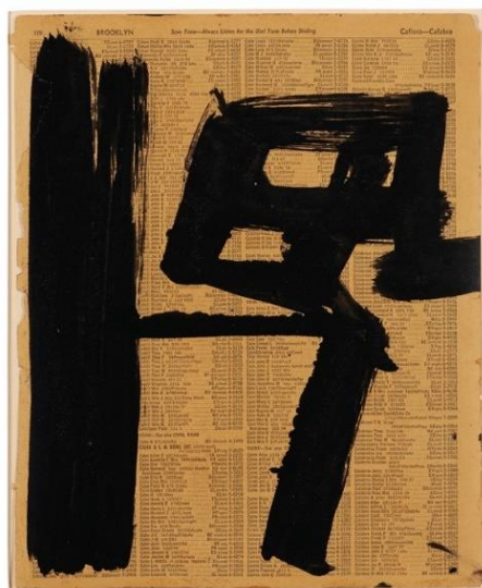
Франц Клайн. Без назви, 1950–1951, чорнило на аркуші з тел. книги. 27,6 x 22,5 см. [1]

Сучасна каліграфія в Китаї зародилася і розвивалася під впливом низки історичних та культурних чинників, серед яких особливо слід виділити реформи та політику відкритості в Китаї після закінчення періоду керування країною Мао Цзедуном. Це стимулювало культурні та мистецькі обміни із Заходом. Знайомство китайських художників з ідеями західного модернізму та авангарду, зокрема абстрактного експресіонізму, концептуального мистецтва тощо.