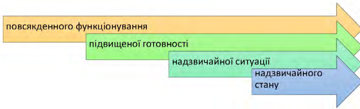
Рис. 2. Функціонування єдиної державної системи цивільного захисту України

Війна в Україні призвела до виникнення нових завдань, які покладені перед єдиною державною системою цивільного захисту України. Відповідно до Кодексу цивільного захисту України, додатковими завданнями єдиної державної системи цивільного захисту у відбудовний період є: проведення цільової мобілізації для ліквідації наслідків ведення воєнних дій та надзвичайних ситуацій; ліквідація наслідків воєнних дій у населених пунктах та на територіях, що зазнали впливу засобів ураження; вжиття заходів для відновлення об'єктів критичної інфраструктури сфери життєзабезпечення населення; визначення населених пунктів та районів, що потребують проведення гуманітарного розмінування, маркування небезпечних ділянок, проведення очищення (розмінування) територій; залучення до ліквідації наслідків ведення воєнних дій та надзвичайних ситуацій міжнародної допомоги 3 .