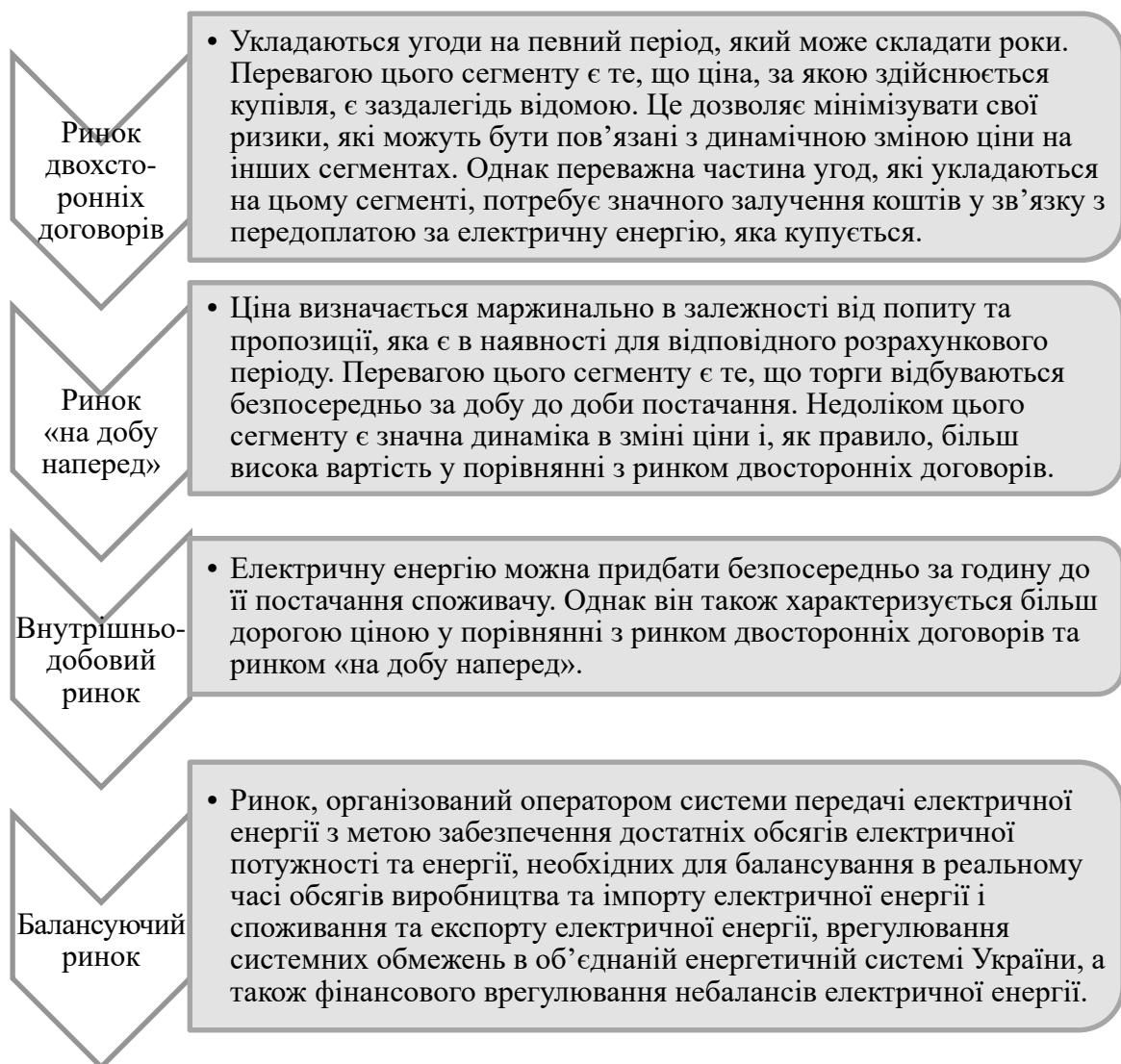
Рис. 1. Характеристика сегментів ринку електричної енергії в умовах функціонування «ліберальної» моделі ринку

Після початку роботи «ліберального» ринку електричної енергії відкрилась можливість здійснювати закупівлю електричної енергії на організованих сегментах ринку та за двосторонніми договорами. Кожний електропостачальник повинен зважити всі ризики, які пов'язані з купівлею електричної енергії на кожному з цих сегментів (рис. 1).