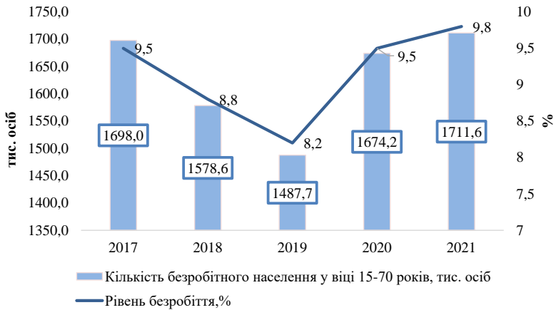
Рис. 2. Рівень безробіття та кількість безробітного населення України у віці 15–70 років (за методологією МОП) у 2017–2021 рр.

показник знизився на 5,8% у порівнянні з 2017 р. Проте у 2020 р. рівень безробіття в Україні почав помітно зростати, що зумовлено спадом рівня зайнятості населення за аналогічний період. У 2020–2021 рр. в Україні загальна кількість недовикористаної робочої сили віком 15–70 років (з урахуванням неповної зайнятості, пов’язаної з тривалістю робочого часу, безробітного населення та потенційної робочої сили) становила біля 1,9 млн осіб., рівень недовикористання робочої сили – 10,5 відсотків. Варто відзначити, що приблизно половина потенційної робочої сили перебували в стані незайнятості 12 місяців і більше, що суттєво загострює ризики довготривалого безробіття [5, с. 25].