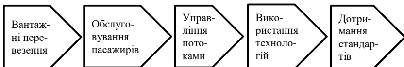
Рис. 1. Ланцюг авіаційних послуг

Таким чином, підвищення якості логістичних послуг в авіаційній галузі є важливим фактором розвитку міжнародної торгівлі, впровадження екологічних практик та забезпечення безпеки перевезень. Провідні логістичні компанії постійно працюють над вдосконаленням своїх послуг у цій сфері.