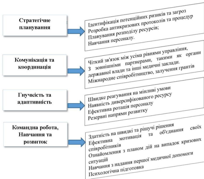
Рис. 1. Основні принципи формування адаптивного механізму управління медичним закладом у кризових умовах

Основні принципи формування адаптивного механізму управління медичним закладом у кризових умовах ми пропонуємо структурувати в алгоритм управлінських заходів щодо антикризового управління (рис. 1)