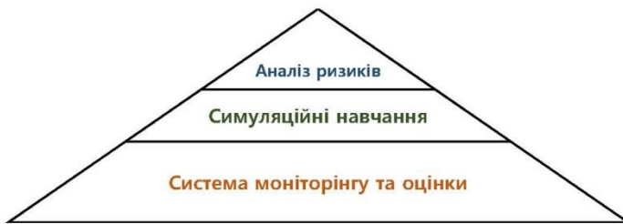
Рис. 2. Трикутник управлінських заходів: інструменти та методи формування адаптивного механізму управління медичним закладом у кризових умовах

Система моніторингу та оцінки (рейтингування): дозволяє відстежувати ефективність механізму управління медичним закладом у кризових умовах.