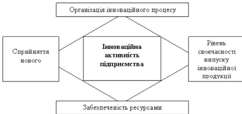
Рис. 2. Ромб інноваційної активності підприємства

Не менш важливою є інноваційна культура в компаніях, що стимулює креативність і сприяє розробці нових продуктів та послуг. Це включає створення сприятливого середовища для навчання, розвиток персоналу, а також використання найкращих практик у галузі управління.