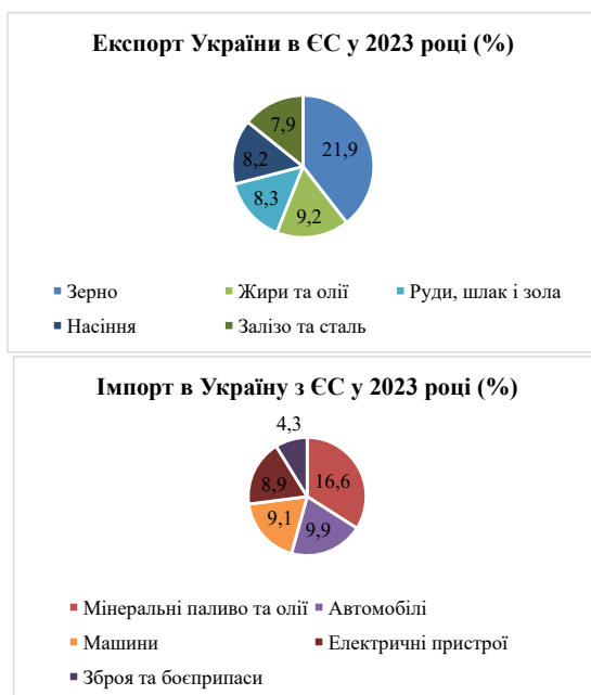
Рис. 2. Структура зовнішньої торгівлі України з ЄС у 2023 р.

Експорт ЄС в Україну у 2023 році становив 39,1 мільярда євро, з основними товарами: мінеральне паливо (16,6%), автомобілі (9,9%), машини (9,1%), електричні пристрої (8,9%) і зброя (4,3%) [3]