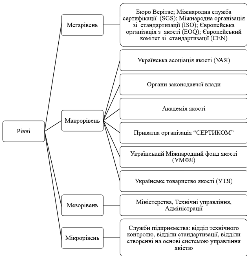
Рис. 2. Рівні нормативно-правового регулювання відносин у сфері якості