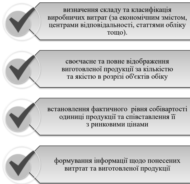
Рис. 2. Завдання виробничого процесу в контексті обліку та оподаткування

Таким чином, виробничий процес компанії визначається, з одного боку, понесеними витратами, а з іншого боку, кількістю готової продукції, виробленої за собівартістю. Метою виробничого процесу є отримання оптимальної кількості високоякісної продукції, товарів, робіт і послуг при мінімізації понесених витрат. Отримання прибутку, мінімізація витрат і збереження матеріальних, природних, фінансових і трудових резервів є завданнями кожної компанії. Завданнями виробничого процесу є (рис. 2):