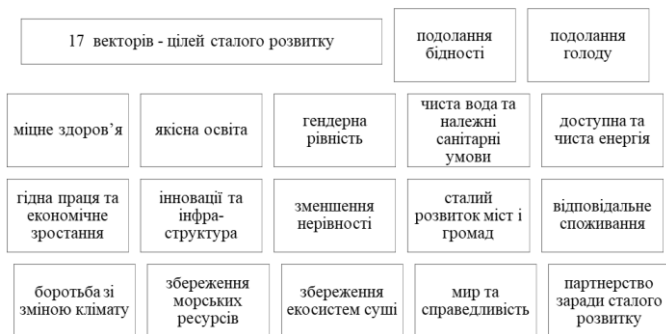
Рис. 2. Вектори-цілі сталого розвитку

У вересні 2015 року резолюцією Організації об'єднаних націй, яку підписали всі 193 члени, ухвалено план 2030 досягнення спільного кращого майбутнього, у центрі якого визначено 17 векторів – цілей сталого розвитку (ЦСР) для всіх без винятків націй та народностей [2].