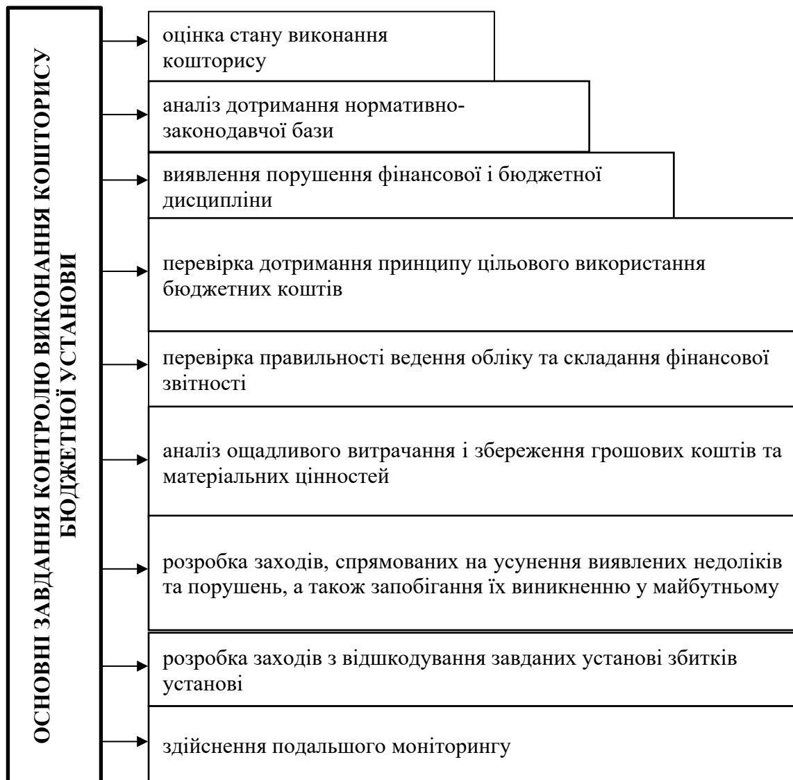
Рис. 2. Основні завдання контролю виконання кошторису бюджетної установи

Завдання контролю виконання кошторису бюджетної установи можна умовно поділити на основні (загальні) та супутні. Так, серед основних завдань можна виділити (рис. 2):