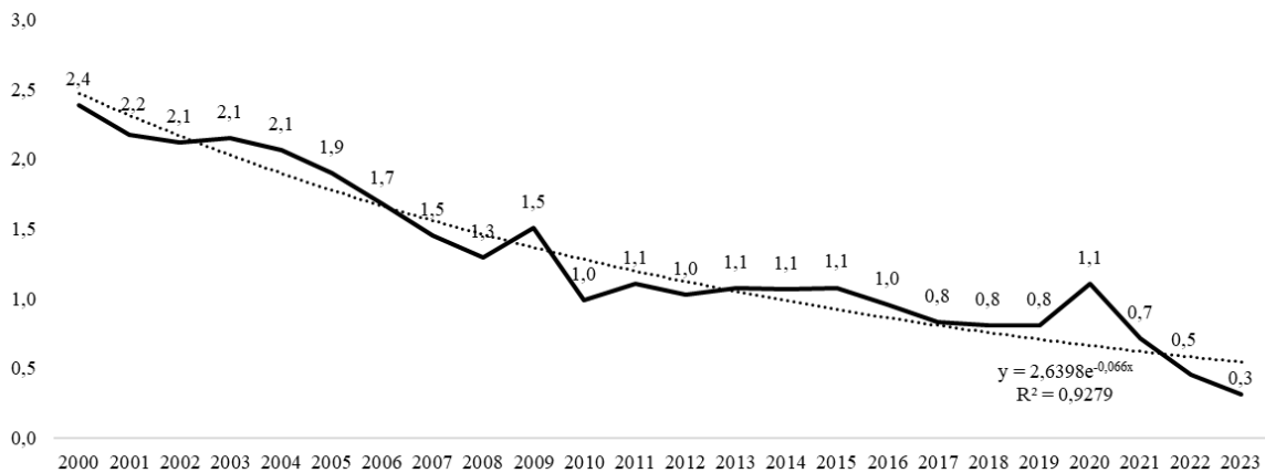
Рис. 2. Частка зареєстрованих безробітних у населенні України, 2000–2023 роки, %