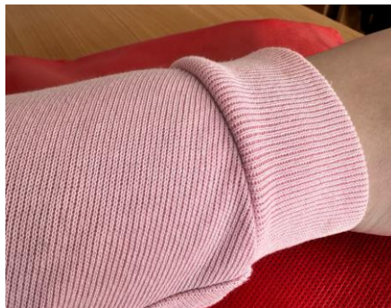
Рис. 1. Рукав та манжет толстовки з різних матеріалів

Розробка капсульних колекцій у базових кольорах значно полегшує процес її фізичного виготовлення, адже немає потреби підбирати тон ниток, тканин-компаніонів тощо. Так, до прикладу, при розробці поширених моделей толстовок використовуються основний матеріал по типу трьохнитки, каш-корсе на манжети та кіперна стрічка (рис. 1).