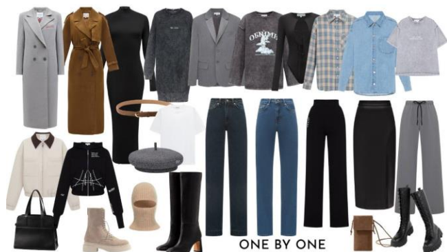
Рис. 2. Капсульна колекція від бренду «ONE BY ONE»

базується на тій же концепції, однак окремі елементи одягу можуть належати до різних торговельних марок. Кожна частина капсули повинна бути взаємозамінною, щоб їх можна було змішувати та поєднувати разом [1]. Капсульний гардероб набагато простіше комбінувати між собою, бо вже є готові образи які підкреслюють один одного (рис. 2).